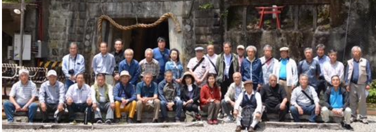
退職者の会から5名が参加しました。

六月六日(火)足尾銅山閉山50周年を迎え、改めて産業遺産である足尾を学ぶ機会として施設見学会が開催されました。 江戸時代から昭和にかけて約四百年にわたり「銅山のまち」として栄えた足尾には、日本の近代産業発祥の頃を物語るたくさんの産業遺産が点在していました。「まち全体を博物館」とする構想のもと、様々な取り組みが進められています。 渡良瀬川上流域での煙害や下流域への鉛毒問題について、環境学習を改めて考えさせられた一日でした。