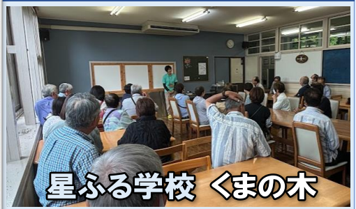
星ふる学校 くまの木

「丁子屋」で堪能し、近くの「那須歴史探訪館」の「平久江家と伝来文書」を見学。四季折々の変化を見せる那須の自然に培われた風土・生活に触れられました。