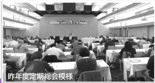
昨年度定期総会模様