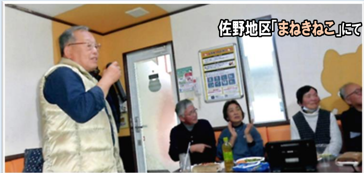
佐野地区「まねまねこ」にて

宇都宮・佐野・栃木の3箇所で開催し、歓談の中それぞれの 持ち歌とデュエットで楽しんでいます。(藤川 政夫)