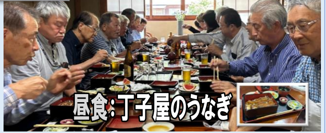
昼食: 丁子屋のうなぎ

今回の施設見学の「星ふる学校」は、栃木県塩谷町の「星ふる学校」旧熊ノ木小学校で、廃校後、宿泊や田舎体験の出来る施設に利用されているところを見学しました。