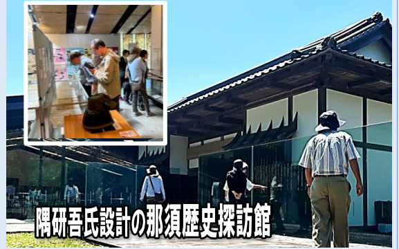
隅研吾氏設計の那須歴史探訪館

最後に、松尾芭蕉の句「田一枚植えて 立ち去る 柳かな」で知られる遊行柳と上の宮湯泉神社の鏡山と呼ばれる石山や大いちようでパワーを頂き、帰路に着き、有意義な一日でした。 (北山)